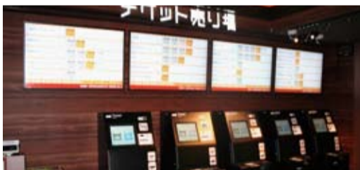
劇場入り口の壁沿いにスムービーが5台設置されています。(左側に有人チケット窓口2台設置)