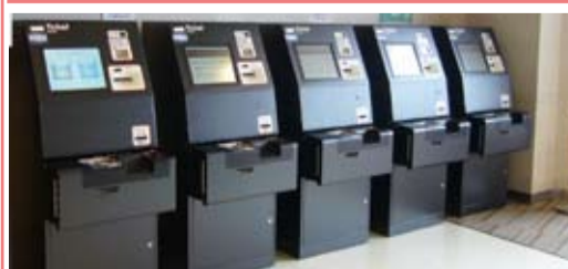
劇場入り口の壁沿いにスムービーが5台設置されています。(有人チケット窓口3台臨時2台設置)