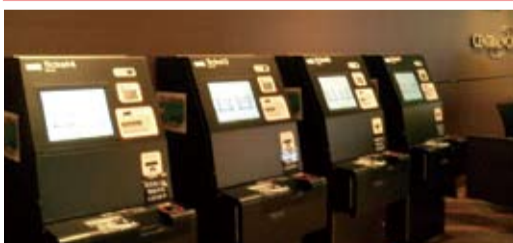
劇場入り口の壁沿いにスムービーが4台設置されています。(有人チケット窓口4台設置)