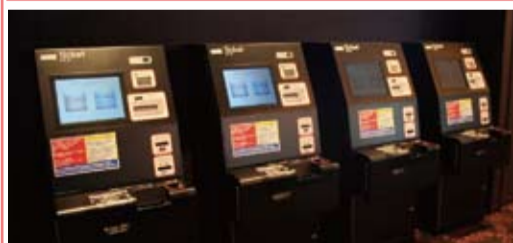
劇場入り口右手にスムービーが4台設置されています。(有人チケット兼グッズ窓口2台設置)