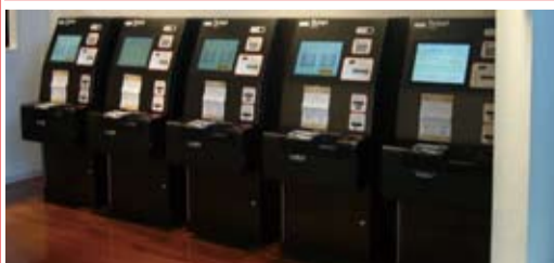
劇場入り口の壁沿いにスムービーが5台設置されています。(有人チケット窓口5台設置)