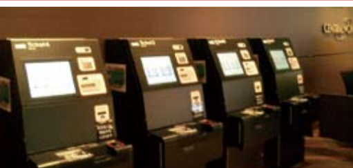
劇場入り口の壁沿いにスムービーを4台設置されています。(有人チケット窓口4台設置)