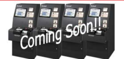
劇場入り口の壁沿いにスムービー5台設置される予定です。(本年秋口)