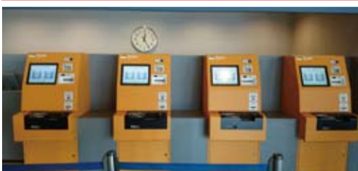
劇場入り口の壁沿いにスムービー4台設置されています。(有人チケット窓口2台、臨時2台設置)