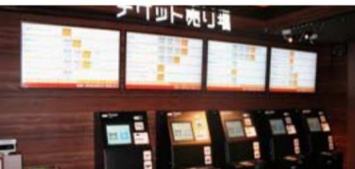
劇場入り口の壁沿いにスムービーが5台設置されています。(左側に有人チケット窓口2台設置)