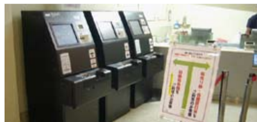
劇場入り口正面の壁沿いにスムービーが3台設置されています。(右側に有人チケット窓口1台設置)