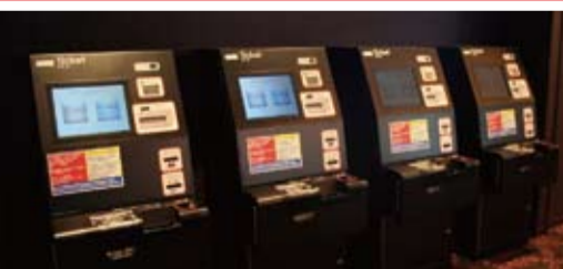
劇場入り口右手にスムービーを4台設置されています。(有人チケット兼グッズ窓口2台設置)