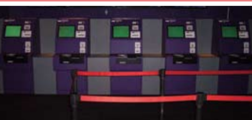
劇場入り口の壁沿いにスムービー5台設置されています。(有人チケット窓口2台設置)