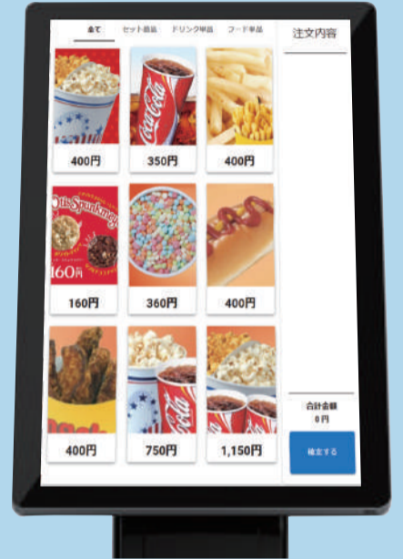
画面はイメージです。

※新システム (COA CINEMA Pro II) 以降のシステムが対象となります。